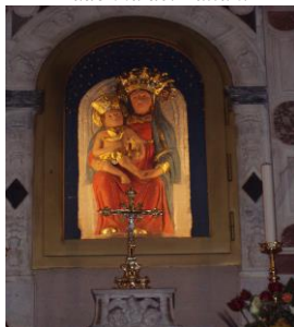
Madonna dei Lattani

In circa venti minuti, tra castagni secolari e bosco ceduo, sempre in discesa - a tratti scivolosa, si arriva alla strada provinciale che da Roccamonfina conduce a Galluccio e a Conca della Campania. Attraversatala (quota 611 m), si prosegue a sinistra sulla vecchia Via Crucis dei Pellegrini e, tra muretti a secco ed edicole votive, si raggiunge, in circa 45 minuti, il Santuario di Maria SS. dei Lattani (765 m).