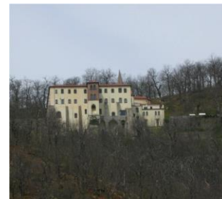
Santuario dei Lattani

In circa venti minuti, tra castagni secolari e bosco ceduo, sempre in discesa - a tratti scivolosa, si arriva alla strada provinciale che da Roccamonfina conduce a Galluccio e a Conca della Campania. Attraversatala (quota 611 m), si prosegue a sinistra sulla vecchia Via Crucis dei Pellegrini e, tra muretti a secco ed edicole votive, si raggiunge, in circa 45 minuti, il Santuario di Maria SS. dei Lattani (765 m).