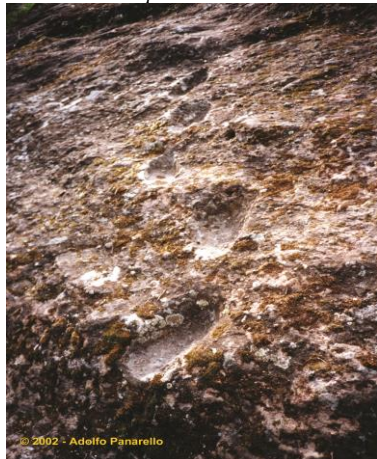
Ciampate del diavolo

Dal sito paleontologico di Foresta (280 m, nel comune di Tora e Piccilli), meglio noto come sito delle “ Ciampate del diavolo ”, di cui verrà data una breve ma rigorosa illustrazione, si imbecca il sentiero alle spalle della chiesa di S. Andrea. Attenzione: Dopo 50 metri dalla partenza, si presenta un bivio: svoltare a destra.