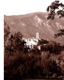
Tora e Piccilli: la Torre